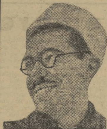
Teniente coronel Tagüena

jor porque ha sido obsesión de la tercera, como de todas las unidades del Ejército, aprender más y más la técnica de la guerra. Siempre han funcionado nuestras escuelas de capacitación.