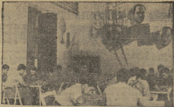
La Escuela de Comisarios de Compañía del XX C. de E.

AÑO II LUNES 12 DE SEPTIEMBRE DE 1938 NUM. 252