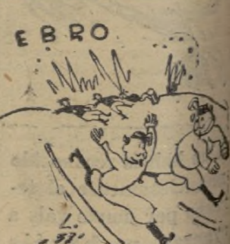
Un italiano.—No se quejen nuestro «Duce» que lo cumplemos sus consignas.