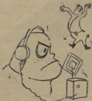
Benito.—Este tío es una fiera echando discursos.

En sus planes, los imperialistas han hecho abstracción de la voluntad de las masas populares, a pesar de que este factor, como lo han demostrado los acontecimientos de España y China, se afirma cada día más fuertemente y con mayor eficacia. Los destinos de la República checoslovaca en las jornadas críticas presentes dependen más que nunca de la firmeza del Gobierno checoslovaco, apoyado por las amplias masas populares del país.—A. I. M. A.