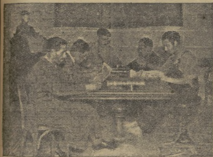
El Hogar de los motoristas

La zona fortificada, guarnecida y defendida por un batallón, se llama centro de resistencia. La guarnecida por una compañía, punto de apoyo. La guarnecida por una sección se llama elemento de resistencia