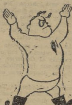
—Triestinos de TRIESTE: Los acontecimientos pueden precipitarse, toman aspecto de un alud, y hay que «DARSE PRI-SA».