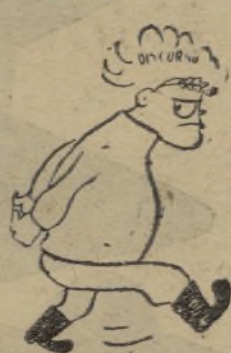
—Pero a mí no me achanta.