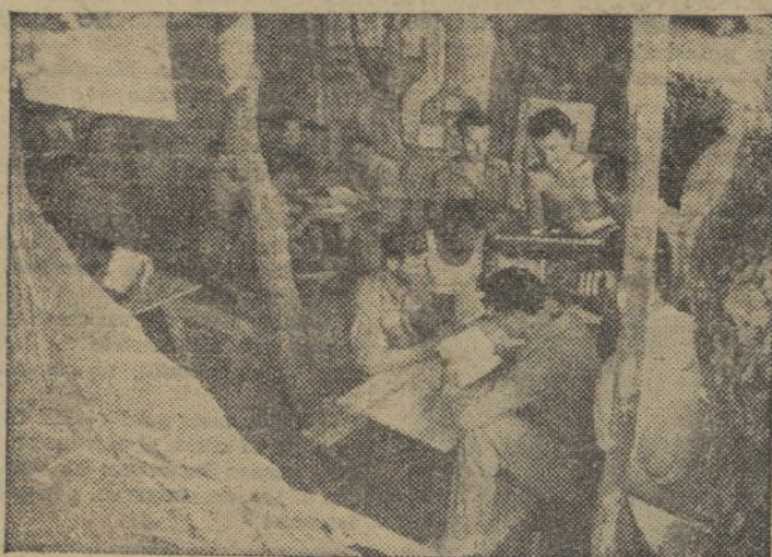
Vigilantes, colaboran en todo instante a la obra de mandos y comisarios

Una obra patriótica: Los Clubs de Educación del Soldado