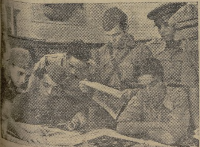
Un rincón del «Llar del Combatent Català»

contra el alud de hierro y de fuego de los ejércitos invasores, los soldados de la República mantienen inmovible la bandera de la libertad.