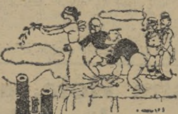
La gallina ciega