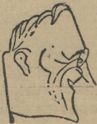
El presidente ROOSEVELT

París, 26.—El presidente Roosevelt ha dirigido al führer un mensaje, al que pertenecen los siguientes párrafos: