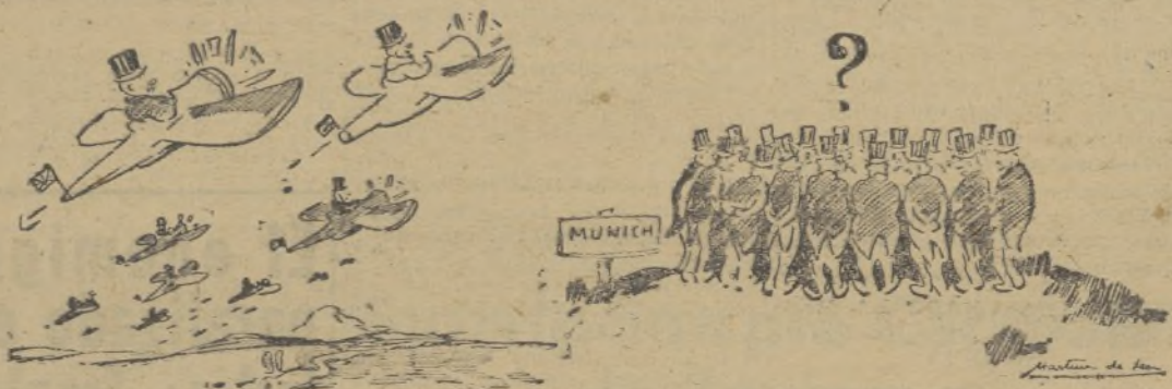
Reunión de rabadanes... oveja muerta

Ca Bar bon. — ¿Cuál es tu verdadero nombre y a qué Cuerpo de Ejército perteneces? Sin estos datos el carnet de correspondencia no te podrá ser remitido.