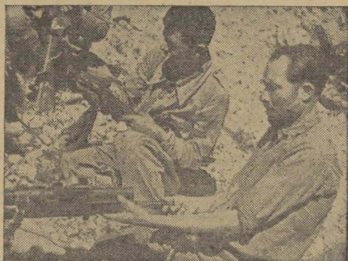
He aquí una tarea diaria y precisa de todo soldado: CUIDAR DE SU ARMA

Cien kilómetros son varias horas de viaje. Unos segundos nada más por el hilo de cobre. Y pueden conducir con la velocidad necesaria las palabras que decidan un combate.