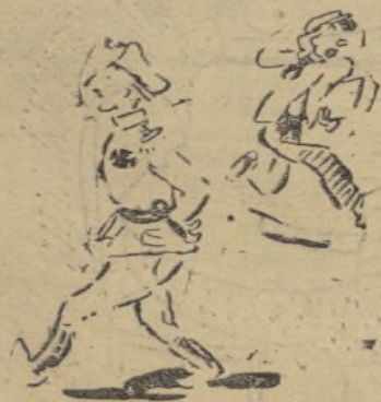
El vendedor.—«La España Imperial», con la retirada de los «voluntarios» italianos.