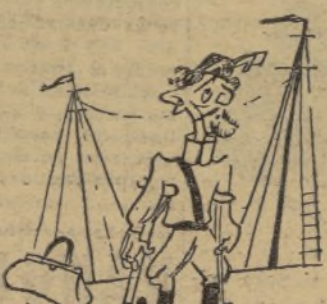
«Voluntario» de 7 meses.