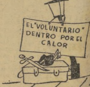
Y así hasta 10.000.