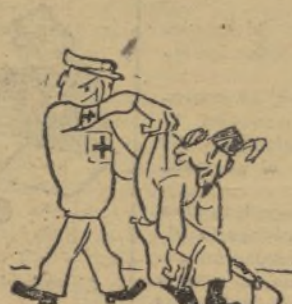
De 12 meses.