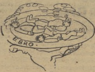
Macarronis a la italiana