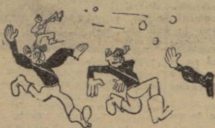
Sopas con honda