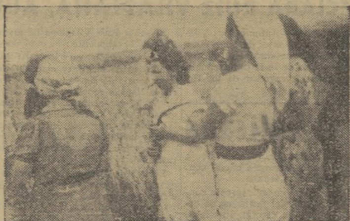
Las obreras de la ciudad confraternizan con las campesinas, descosas de ayudar a la victoria

París, 19.—En su editorial, "L'Humanité" hace constar que veinte mil refugiados de los sudetes han sido ya entregados a Alemania y pide que, a pesar de los métodos tendenciosos del Quai d'Orsay, que continúe la acción para salvar a los alemanes antifascistas de los sudetes.—A. I. M. A.