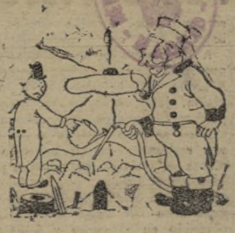
La cosecha de Munich