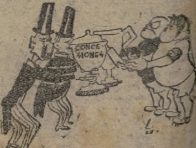
Reparto de premios a los campeones