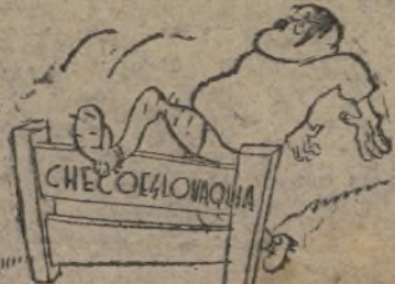
100 metros vallas