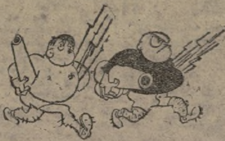
Carrera de los armamentos