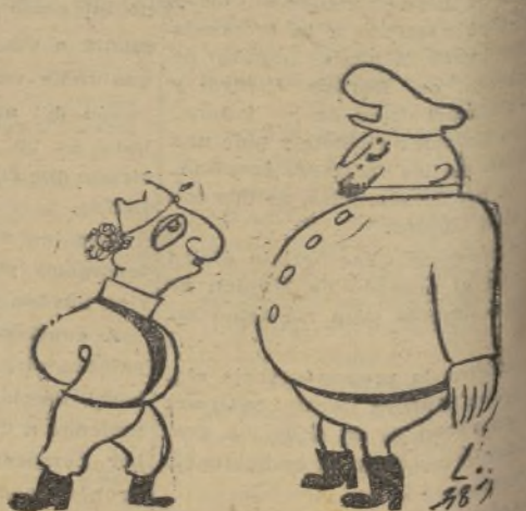
El generalísimo: —Que me preparen el paracaídas, que voy a dar un paseo en tranvía.