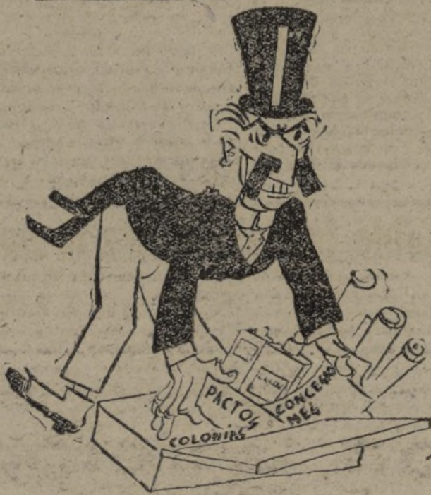
—Iré preparando la maletita, pero me parece que esta vez me va a salir caro el exceso de equipaje.