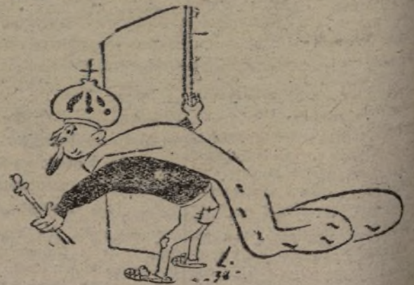
El rey: —¿Me llamaban?