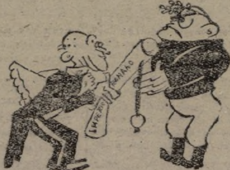
—En nombre de mi gobierno, reconocemos al nuevo rey y emperador de Abisinia.