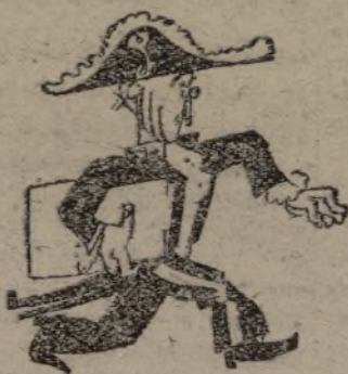
—Veremos a Bonito.