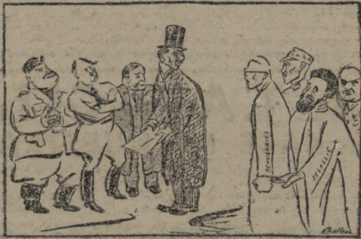
Los cuatro: ¿Qué desean ustedes? (De «The Tribunes» de Londres.)

Todo descansa sobre los comunes fundamentos de mutua tolerancia y respeto. (Halifax.)