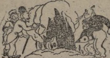
Incendiarlos y bomberos Ayuntamiento de Madrid