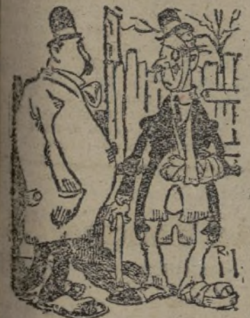
Deformación profesional. —¿Está usted herido? —No. Es que soy representante de un ortopédico.