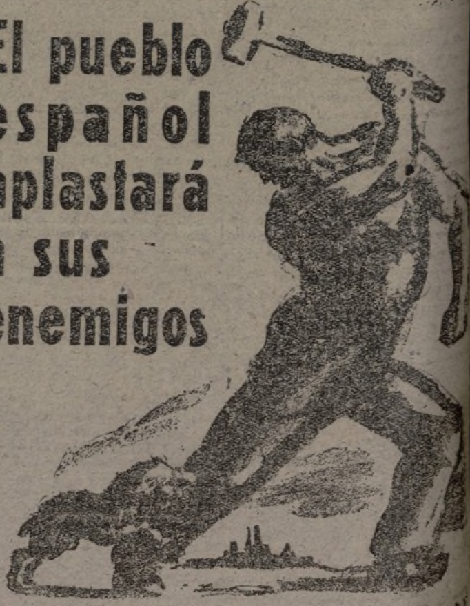
(Dibujo de FRED ELLIS, en «New Masses» de Nueva York)

El pueblo español aplastará a sus enemigos