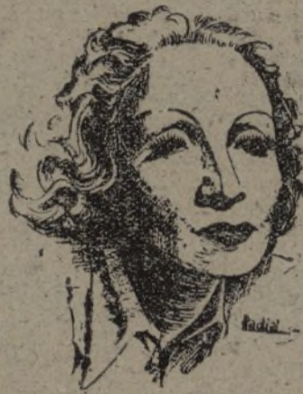
Marlene Dietrich, la gran artista cinematográfica, que ante la barbarie nazi ha renunciado a la nacionalidad alemana. Marlene es también buena amiga de España

«Sabemos que se nos van a enviar estudiantes nazis. Resistiremos por todos los medios a cualquier agitación o propaganda extranjera. Contamos con la acción energética de nuestras autoridades y no dudaremos, llegado el caso, en bastarnos a nosotros mismos.» —Fabra.