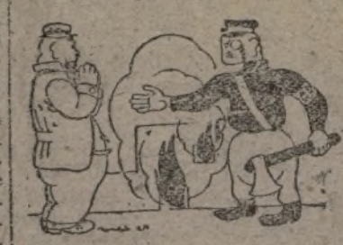
—Nos provocan a asesinarlos que el mundo nos condene!

El chantaje italiano continúa en marcha. Se han reproducido en diversas ciudades las manifestaciones «espontáneas» controladas, organizadas y dirigidas por Mussolini, reclamando Túnez, Córcega y Niza. Los estudiantes han sido elegidos por Mussolini para actuar de marionetas. Y la policía ha llegado incluso a retirar de comercios y hoteles los letreros en francés. En cualquier otra época, Francia habría movido a toda prisa y sus ejércitos correrían a la frontera italiana para defenderse de una posible agresión. Pero hoy no ocurrirá nada de esto. La agresión no se realizará. Mussolini sabe bien lo que hace. Y hasta ahora, sus gritos histéricos sólo han servido para prestarle un buen servicio a Daladier. Ante la amenaza fantasma de «LA PATRIA ESTA EN PELIGRO!», ha conseguido el Gobierno Daladier eliminar oposiciones de orden interior a su política, uniendo a todos los franceses en su política exterior. La C. G. T., después de resaltar la ilegalidad de la represión, se declara dispuesta a entablar negociaciones para el cese de los conflictos.