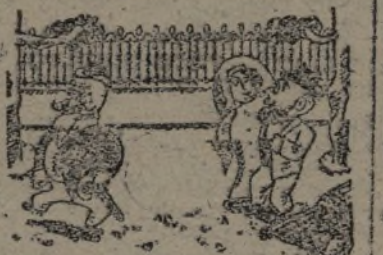
EL VIEJO OFICIAL

Por este procedimiento han conseguido los rebeldes montar el fichero de los millones de sentenciados a penas de muerte.