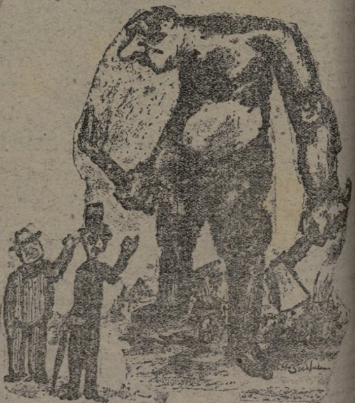
Daladier y Chamberlain:—¿Que viene el «coco»!

El mural lleva por título la aspiración que cada buen español siente hoy al contemplar la Patria invadida: Independencia. Bajo este grito conviven y comulgan, tratando los problemas comunes desde las mismas columnas. Cada día que pasa se unifican más los anhelos. Es así, y felicitamos al XXII Cuerpo por su iniciativa, como se debe establecer este sentido fraterno que existe desde hace mucho en cada soldado y en cada campesino, fundamental para la consecución de lo que a todos, vanguardia y retaguardia, nos es común: la Independencia de España.