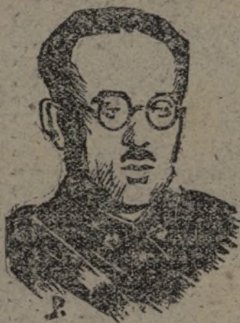
El general Rojo, jefe del Estado Mayor Central, cabeza directora de la victoriosa operación

Cerca de las 7 de la mañana, muchos aparatos despegaban de nuestros aeródromos de Levante. Hacía mal tiempo y los pilotos tendrían también que luchar con la nieve. Era una gran mancha de aviones que movían hacia arriba todas las cabezas de la gente de tierra. Mujeres, campesinos y niños siguieron a los aviones con los ojos, hasta que se perdían. La dirección era hacia Teruel.