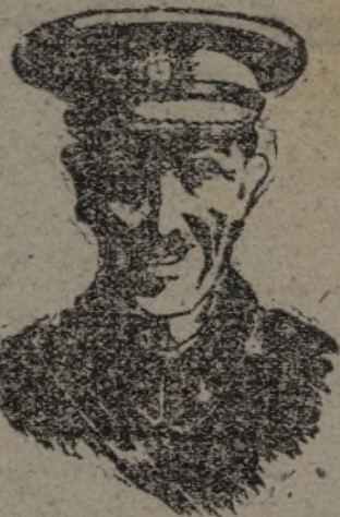
El general Hernández Saravia, jefe del Ejército de Levante cuando nuestra ofensiva sobre Teruel

No había pasado mucho tiempo de la toma de estas últimas posiciones cuando una columna del Ejército Popular caminaba carretera del Puerto Escandón adelante. Iba camino de Teruel y ni el frío intenso que se recrudecía, ni nadie, eran capaces de detenerla. Habíamos estado hasta entonces a tiro de artillería de la ciudad.