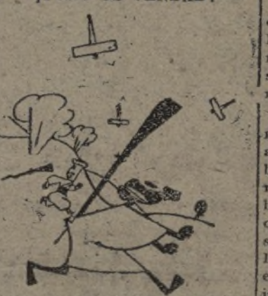
¿Quién ha dicho que no cobran?