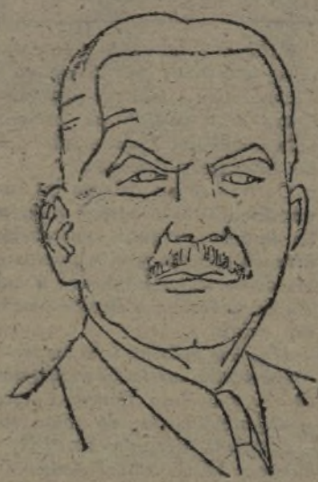
Don Pedro Aguirre Sardá, presidente de la República de Chile, como consecuencia del triunfo electoral del Frente Popular