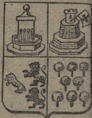
Escudo de Fuenteovejuna

Ayer este bravo pueblo fué libertado por las armas de la República y el extranjero invasor se ha visto despojado de las riquezas que Fuenteovejuna posee. Cereales, vino, dehesas de encinares y ganado; importantes minas de carbón, plomo y mica, e industrias varias. Alemanes e italianos no podrán llevarse estas materias primas que les son necesarias para su política de invasión. El Ejército Popular, en esta su última ofensiva, ha conseguido libertar a un pueblo de historia