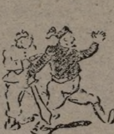
La invasión truenca: ¡A Túnez por Barcelona!