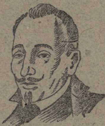
LOPE DE VEGA

Este ha sido el asunto que, tomado por Lope de Vega de la «Crónica de la Orden de Calatrava».