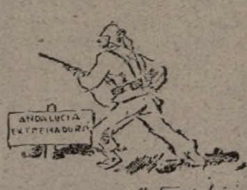
El español avanza: ¡España de los españoles!