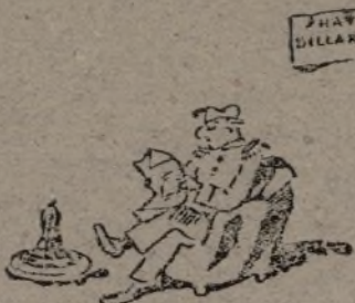
La tonta del bote se informa.