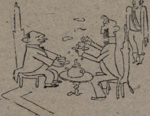
—Té a la francesa. Ayuntamiento de Madrid