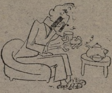
—Té a la inglesa.

EL TE DE CHAMBERLAIN (o la próxima visita), por Lozano