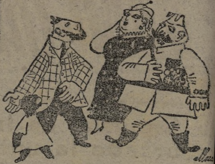
—¿Es suyo, coronel?