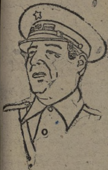
El coronel Perea

Disponiendo que el general del Ejército don José Asensio, pase como agregado militar de la Embajada de Washington.