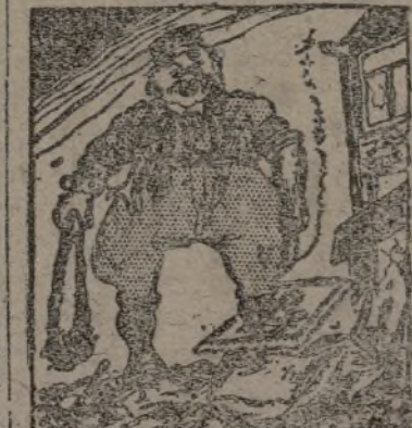
El nazi.—Qué gran arma la civilización sovi

Leon Blum, en «Le Populaire», hace observar que si el plan aprobado en Londres por el Comité de No Intervención se hubiese ejecutado, haría muchos meses que las tropas extranjeras habrían sido retiradas del territorio español del lado nacionalista, y agrega: «¿Cómo podría mantenerse la decisión adoptada por el Gobierno francés cerrando la frontera de los Pirineos? Eso no puede continuar y estoy convencido de que no continuará».—Fabra.