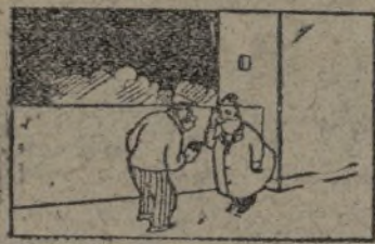
— ¿Puede escribirme en un papelito lo que desea? Soy sordo como una tapia.

Como dice el general Cointet, en unas páginas preliminares, el servicio de escucha constituyó una ayuda preciosa para completar o confirmar toda la masa de datos e informes diversos que las segundas Secciones utilizan para tener informado al Mando. La escuela telefónica vino a ser, desde su aparición en el ejército francés, a fines de 1914, una especie de revolución, «como en la medicina el descubrimiento del método de la auscultación», captando, como por arte mágico, toda una serie de noticias, movimientos y preparativos que los ejércitos deben mantener en el secreto. El buen instinto de los soldados encontró en seguida un nombre apropiado para los es-