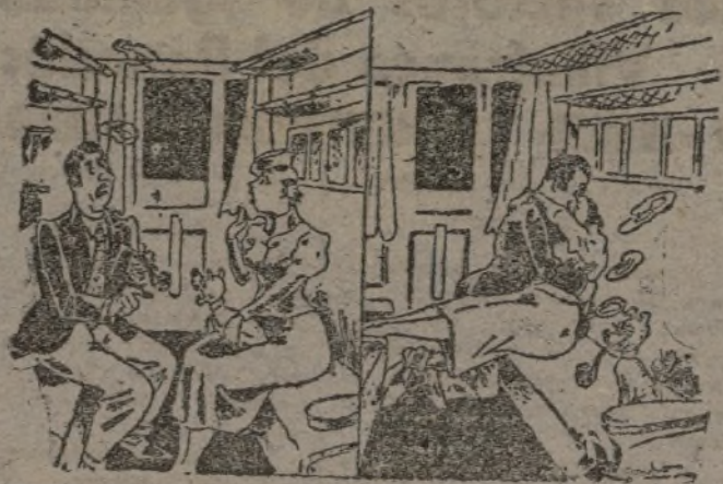
EN EL TREN. Primer cuadro. Ella. — ¡Me molesta su pipal! Segundo cuadro. Una hora después.

Habiéndose extraviado un carnet a nombre del comisario RICARDO CALVO MIGUEL, se ruega que, caso de haber sido hallado, sea entregado en el Comisariado del Ejército de Levante.