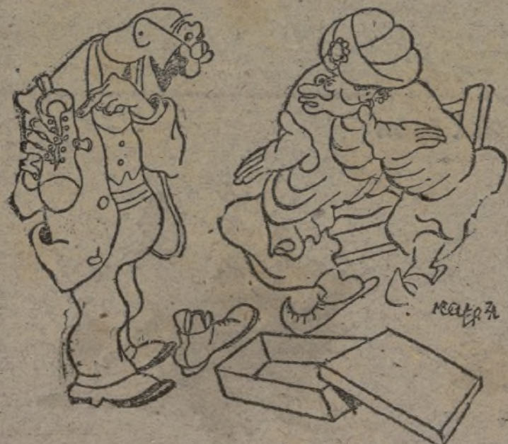
EL FAKIR COMPRO BOTAS.

Madrid, 21.—La suscripción pro campaña de invierno, en la provincia de Madrid, alcanza ya la cifra de 4.176.500 pesetas, figurando, entre otras aportaciones importantes, las siguientes: U. G. T., octava entrega, 80.000 pesetas; undécima de haber del Cuartel General del Ejército del Centro, 12.739 pesetas; y Consejo Provincial de Toledo, 50.000 pesetas.—Agencia España.