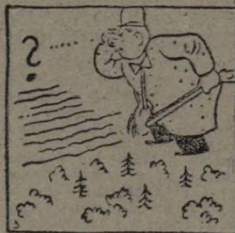
Un perro bien educado.