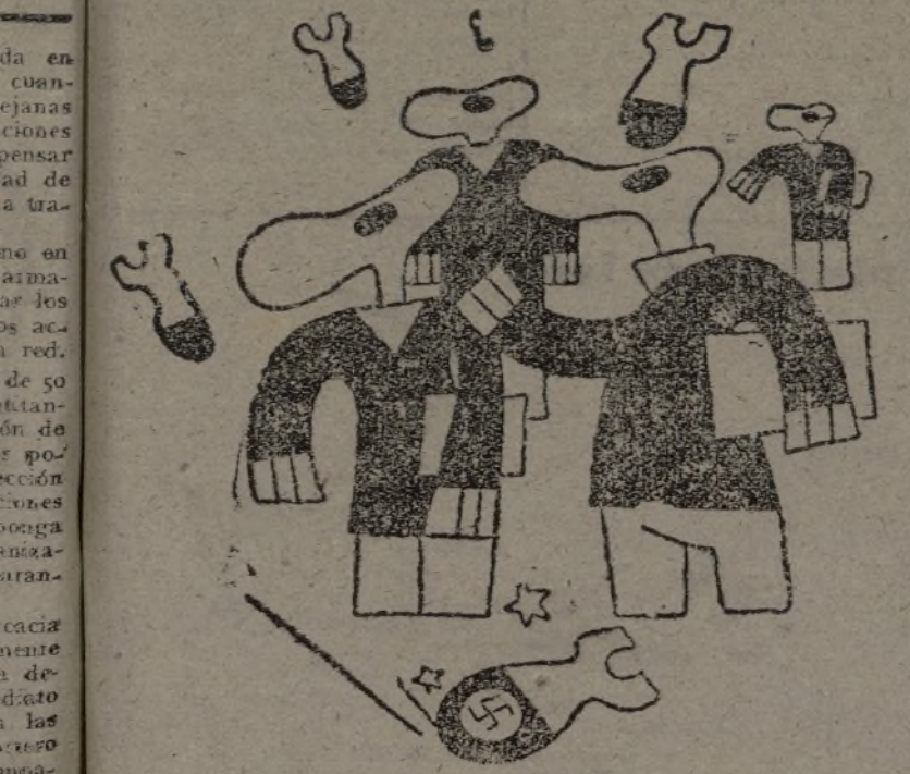
ESTUDIANTES INGLESSES —Se aprende más en un día en España que en dos años en Londres.

Santiago de Chile, 27.—Todos los obreros chilenos han entregado un día de jornal para ayudar a las víctimas del terremoto. Se prevén otras jornadas de solidaridad y varias sociedades han decidido entregar el 10 por 100 de sus beneficios durante el ejercicio de 1933. El número conocido de muertos y heridos aumenta por momentos. En Chile han sido ya enterrados tres mil cadáveres. Las autoridades no permiten la entrada en la zona siniestrada más que a las personas que acuden a la misma para llevar víveres. Se teme que el número de víctimas pase de veinticinco mil. En Concepción los daños ascienden a trescientos millones de pesos. Comienzan a aparecer focos epidémicos y la población siniestrada será evacuada con toda rapidez.—Fabra.