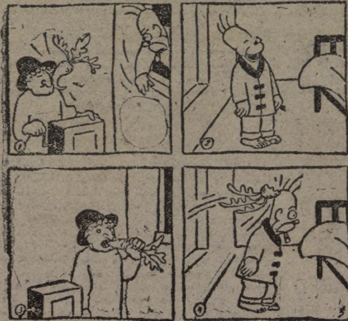
ADAMSON, por O. JACOBSON

El consulado de Italia y las escuelas italianas de la ciudad tienen un fuerte servicio de protección para evitar cualquier incidente. —Febus.