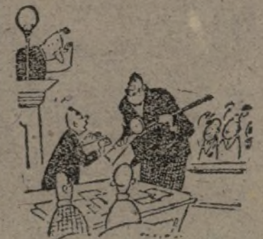
—Demuestre usted al jurado cómo utilizó el fusil ametrallador.