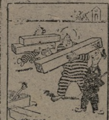
—Lleva más peso que yo. ¡Es tan perezoso que prefiere no hacer dos veces el camino!

Para que no seamos verdugos de nosotros mismos, de nuestros más queridos seres, y para que nuestra raza española sea digna de su historia, en este aspecto debemos ayudar a impulsar las prácticas higiénicas y la cultura física, apor-