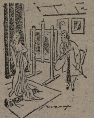
La modelo (irritada).—Me podía haber avisado que usted realmente es un pintor!

Valencia, 1.—El gobernador ha hecho pública su satisfacción por las actividades que desarrollan los alcaldes de la provincia encaminadas a favorecer la movilización general.