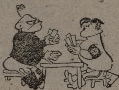
Benito. — ¡Envido a la grande!