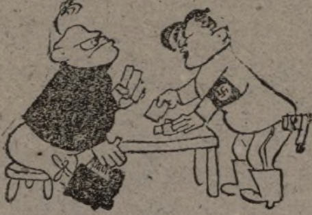
Adolfo. — ¡Cinco más!