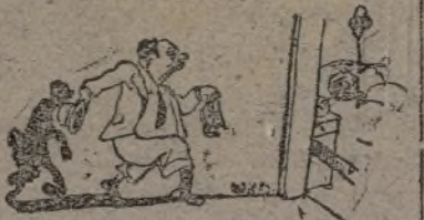
El candidato a dictador llega tarde a su casa.

"La fuerza de Francia—dijo—no reside en declaraciones más o menos solemnes sino en su alma, en su potencia y en la unión de todos los franceses".—Fabra.