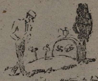
Y si todos estamos firmemente en nuestro sitio, el invasor también tendrá el suyo. Sólo habrá que enterrarlo boca abajo por si se quiere salir...