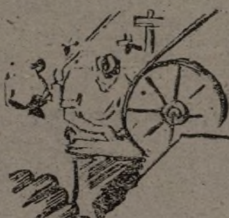
El técnico, en su especialidad.