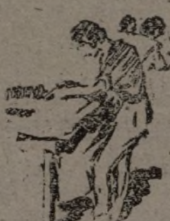
La mujer, sustituyendo al hombre.