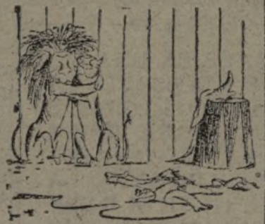
—Al fin, ¡solos!

El diputado republicano Pace, refiriéndose a la cuestión del rearme ha declarado: «Estoy convencido de que si el presidente no ha dicho que la frontera militar está en el Rhin, pudo decir, sin embargo que nuestras primeras líneas de de-