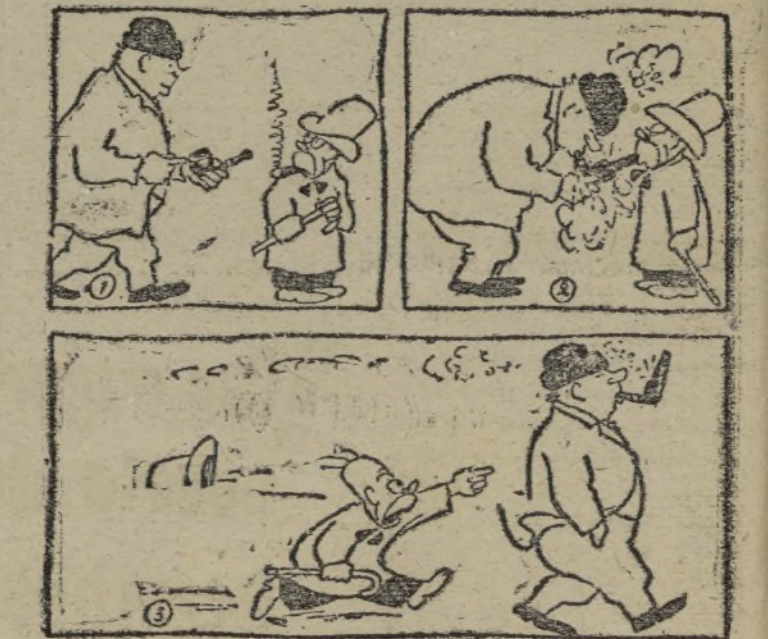
ADAMSON, por Jacobson

Al objeto de ser publicados todos los donativos en VANGUARDIA, deberá enviarse relación de ellos a nuestra oficina en Valencia, Trinquete de Caballeros, 9.