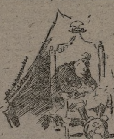
El «camo» del mundo duerme.