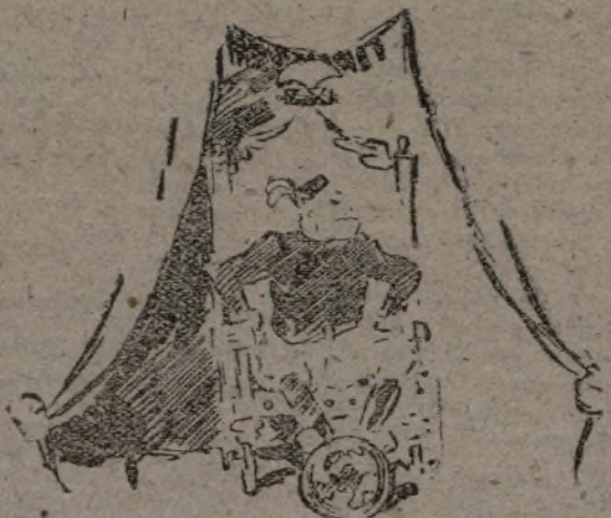
He ahí al «camo» del mundo.