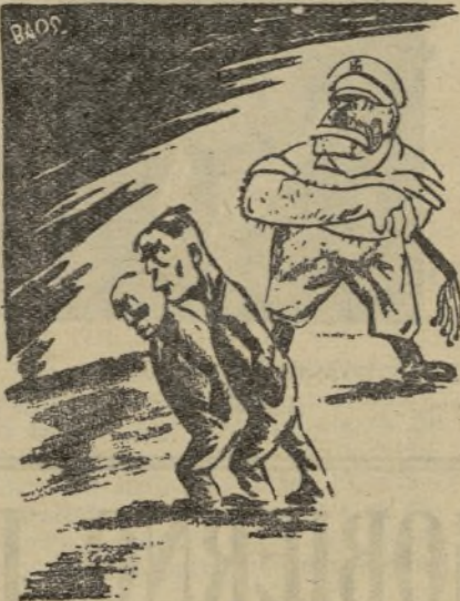
... y como desearía verlas (Por Baos)