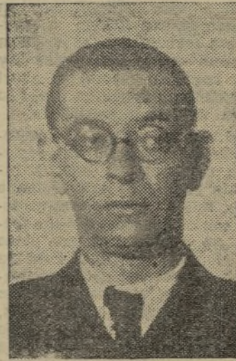
JULIÁN ZUGAZAGOITIA Gobernación