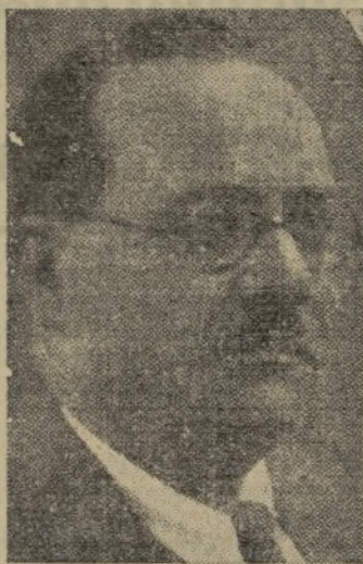
JUAN NEGRÍN Presidencia, Hacienda y Economía