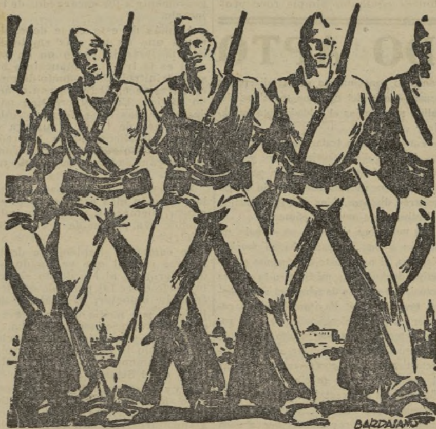
Los traidores y sus cómplices se estrellarán ante el muro férreo de nuestros soldados.

Nos figuramos al "Niño de Triana" cantando soleares en el idioma del Dante.