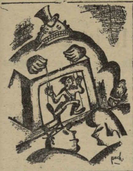
EL GRAN GUINOL

Krupp, el fabricante de armamento, mueve sus fantoches.