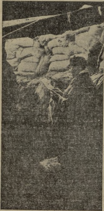
El periódico lleva a los parapetos el fervor de los camaradas que laboran en la retaguardia para que nada falte a los combatientes