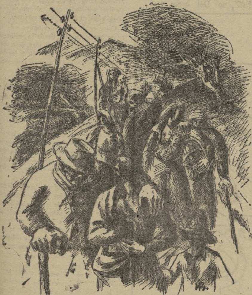
A la aproximación de las hordas facciosas, las mujeres, los niños y los viejos de las aldeas huyen, llenos de dolor y de espanto.

He aquí a grandes rasgos la obra del fascismo en el campo. He aquí a lo que han quedado reducidos los beneficios que el "nazismo" prometía a las clases menesterosas de Alemania. Persecuciones, hambre, miseria moral y material son la única realidad en medio de tanta hueria palabrería.