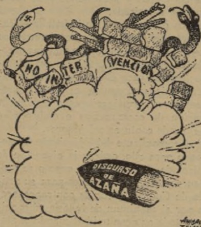
La fuerza de la razón o verdades como obuses

PARIS.—Comunican de Roma los siguientes detalles de una crónica del corresponsal de guerra en España del "Corriere della Sera", relativos a la batalla de Brunete: