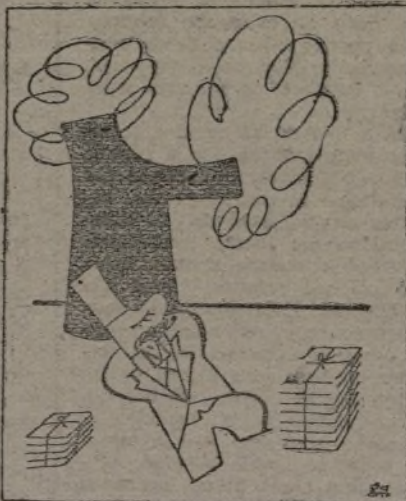
Se reúne el Subcomité.