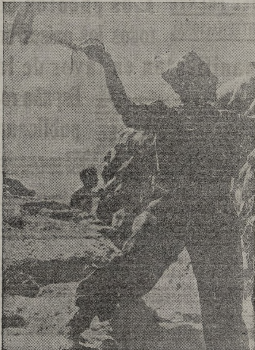
UN SOLDADO LANZANDO UN PAQUETE DE IMPRESOS A LOS PARAPETOS FACCIOSOS

Lo comunico a V. E. para su conocimiento y cumplimiento. Valencia, 3 de agosto de 1937.—PRIETO.