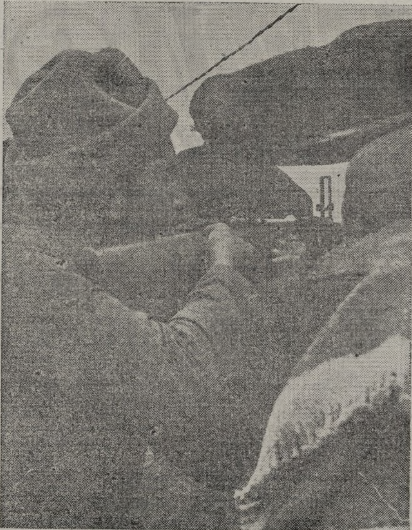
El pueblo que, sin medios para ello, venció al fascismo, hoy tiene ya un gran Ejército regular