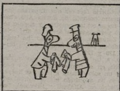
sin pasar por miliciano