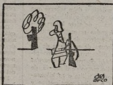
pronto será veterano