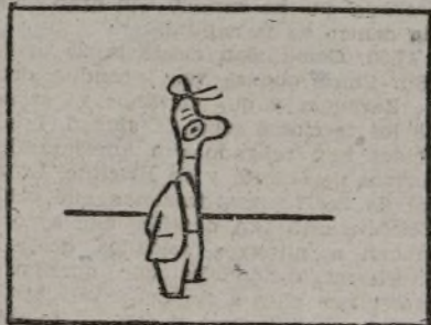
Este recluta paísano,