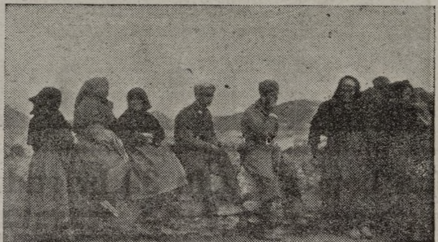
Nuestros soldados fraternizan con las viejas aldeanas

Los jefes, oficiales y comisarios vean en esta serie de trabajos un estímulo y una ayuda. Y estúdienlos concienzudamente.