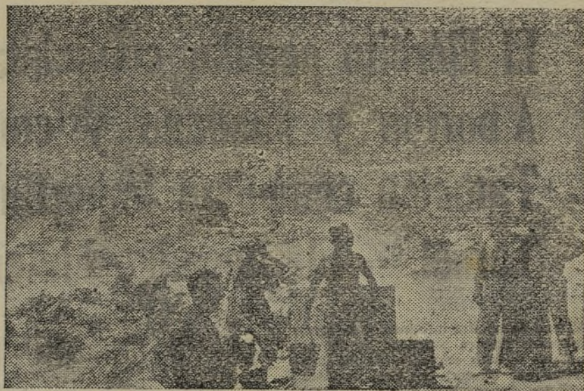
En todos los sitios, sean cuales fueren las circunstancias del paraje en que acampen, nuestros soldados se ocupan de su limpieza e higiene. Así es como se consigue tener un Ejército de hombres sanos y fuertes.