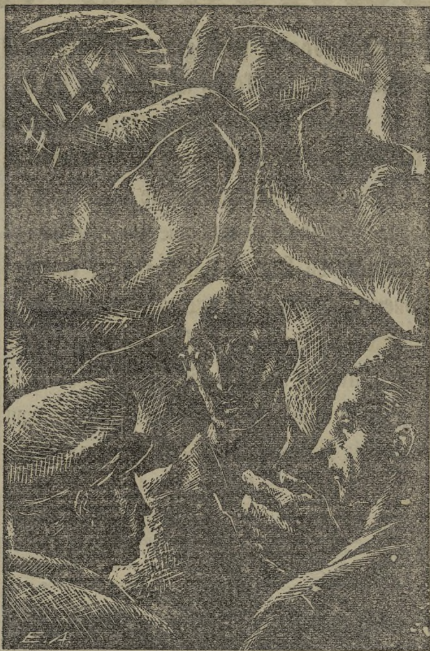
Soldados no olvidéis, cuando habléis, que puede oírte algún espía. Se prudente y discreto en tus conversaciones. No des a NADIE datos militares

Pero los nuevos oficiales, los nacidos de las entrañas del pueblo, al salir de las Escuelas Populares de Guerra, lo hacen dispuestos a impedir que esa compartición impúdica se lleve a cabo, y para ello cuentan — son también palabras de nuestro Comisario general — con un Ejército dispuesto fielmente a seguirles por la senda luminosa de la victoria.