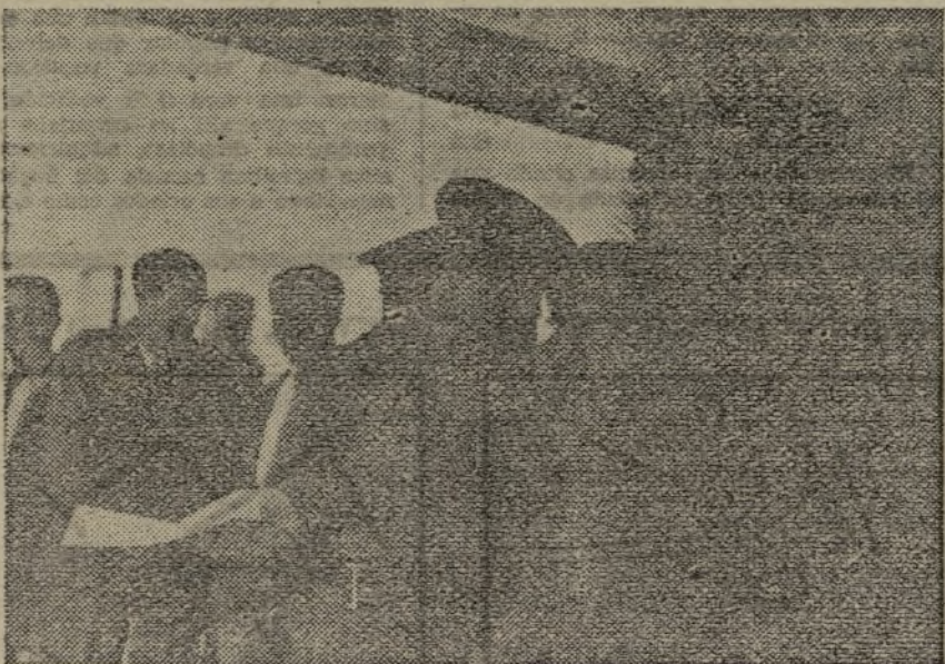
El Comisario general de Guerra, camarada Alvarez del Vayo, entregando los despachos de oficial a los alumnos de la Escuela Popular de Guerra núm. 3.

"Después del discurso de Mussolini y de la apertura de las hostilidades chino-japonesas, nos hallamos ante una nueva situación internacional. Por ello, la opinión pública de los países democráticos espera con justa razón que el problema español vuelva a ser examinado nuevamente en su conjunto." (Fabra.)