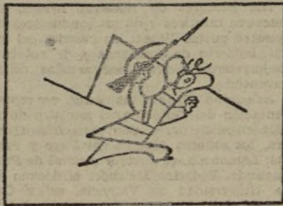
por su genio temerario,