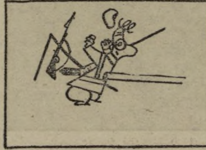
quiso ser un bromedario