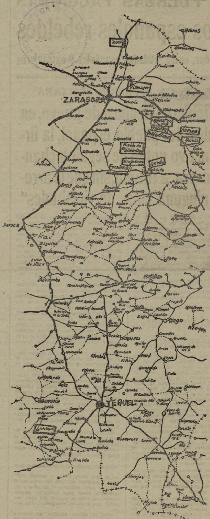
Mapa de conjunto de las zonas en que operan nuestros Ejércitos del Este y de Levante.

Nuestras fuerzas que operan en este sector Norte de Teruel pudieron apreciar fuerte tiroteo en el interior del pueblo de Santa Eulalia, a cuyas proximidades llegaron en su avance del día 27. Después vieron salir fuerzas de dicho pueblo hacia las afueras del mismo. Dichas fuerzas hicieron fuego sobre el interior de Santa Eulalia. Nuestros soldados pudieron apreciar perfectamente que se trataba de fusilamientos.