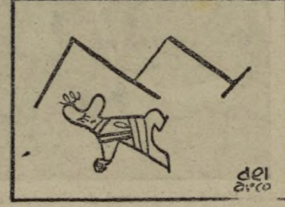
y fué a parar a un osario