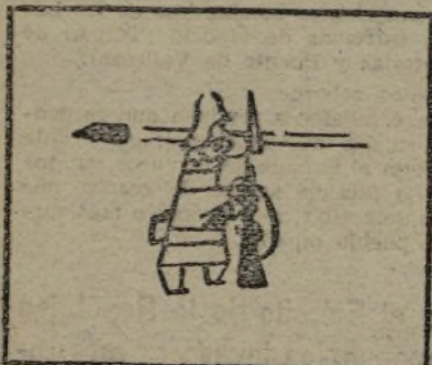
Abnegación en el NORTE