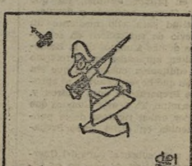
Heroísmo en el OESTE