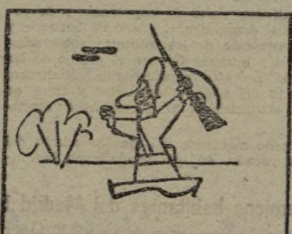
Disciplina en el SUR