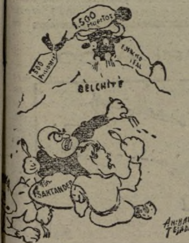
ISE AGUO LA FIESTA!