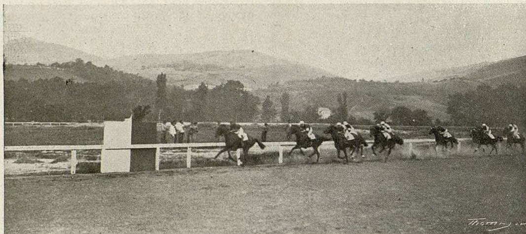
Hipódromo de San Sebastián : En plena lucha

NUESTRO público, el público distinguido y aristocrático de todas las grandes ciudades, considera como uno de los más bellos acontecimientos las carreras de caballos; pero como es un espectáculo en cuya organización y para poderlo llegar a celebrar en condiciones nada más que decorosas, han de invertirse sumas de extraordinaria importancia, de ahí que, salvo en Madrid, hayan dejado de verificarse carreras en aquellas ciudades que, como Barcelona y Sevilla, cuentan con hipódromos.