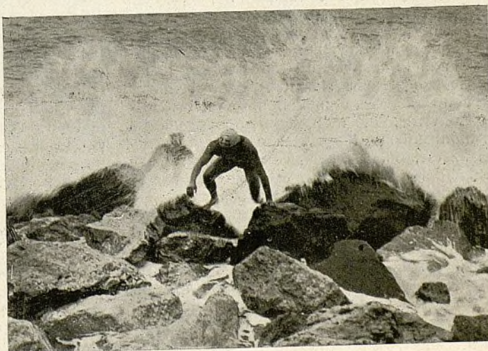
Berdemás, al salir del agua

El éxito coronó los esfuerzos de los organizadores, siendo el festival del domingo un bello prólogo de la fiesta de mañana.