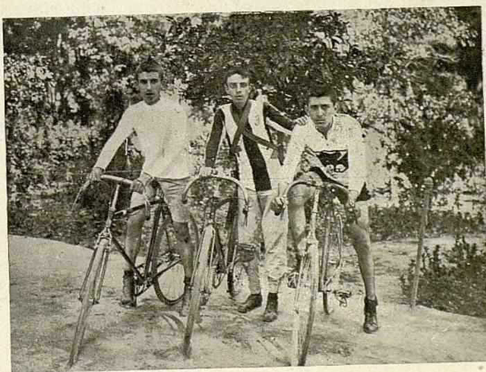
Los vencedores de las carreras de neófitos, celebradas en Sevilla el día 3 del actual

En la Prensa de aquella capital y en las cartas que nos envían «Bolepronto» y «Embalage», nos auguran mejores noticias para fecha no lejana, lo que nos dará nueva ocasión de aplaudir a los simpáticos sportsmen sevillanos, que han desechado por siempre jamás el spleen .