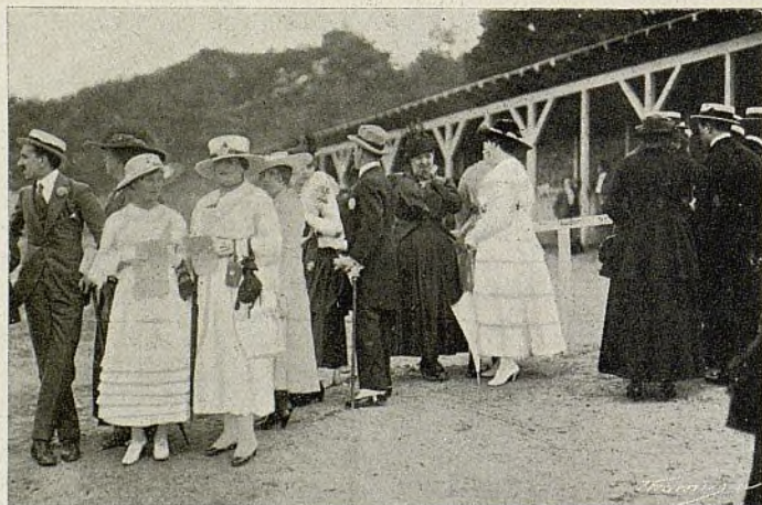
Hipódromo de San Sebastián : Las elegantes del turf

Hasta ahora, tan sólo el grandioso hipódromo de San Sebastián, inaugurado a principios de año, responde a aquella feliz iniciativa. En él se han verificado grandes carreras, participando las más afamadas cuadrillas con algunos de sus mejores caballos. Nuestras fotografías dan una idea del espectáculo a que han asistido los felices mortales que han visitado la bella Easo.