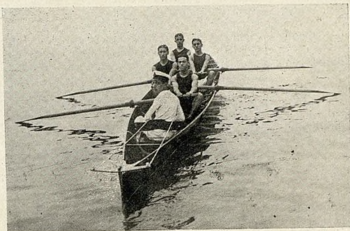
La tripulación vencedora de la regata de debutantes, organizada por el R. C. M. B.